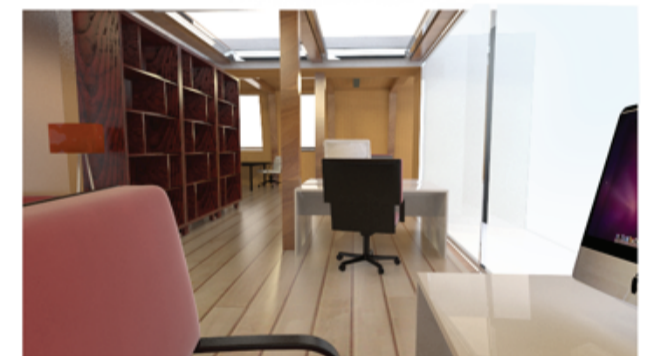
Вид интерьера второго этажа

При разработке архитектуры здания мы ставили перед собой задачу максимально отразить через форму суть деятельности компании. Поскольку для строительства домов заказчик использует клееный брус, наилучшим решением было взять характерную форму сечения бруса для фасада. Идея натуральности и "древесности" дополняет также использование того же бруса в качестве основного материала. В сочетании с панорамным остеклением и конструкцией тимберфреймом из клееного бруса получается легкая светлая конструкция, напоминающая о лучших образцах современной американской архитектуры.